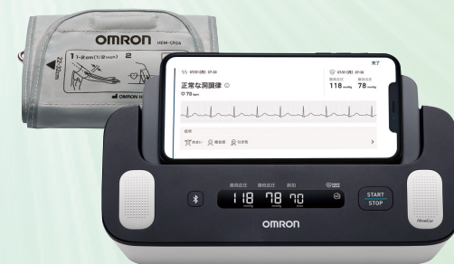
心電計付き血圧計

これをスマートフォンのアプリで自動分析。心疾患のリスクが確認されると、スマートフォン上に「心房細動の可能性」などと表示されます。記録データは医師との共有にも活用できます。高血圧の人はそうでない人と比べて心房細動である確率が3倍とのデータもあります。